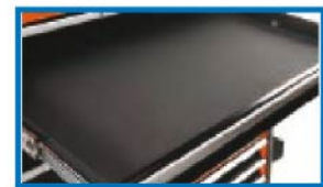
Grease-resistant EVA drawer liners keeps tools in place