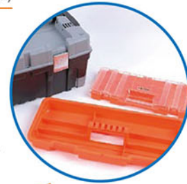
Removeable top organizer and tote tray