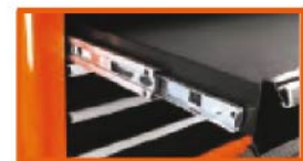
Heavy-duty full-extension ball bearing drawers