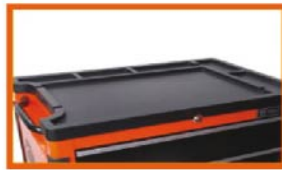
Built-in storage compartment