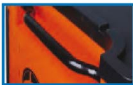
Flush mount push bar for easy cabinet movement