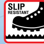
พื้นรองเท้ากันลื่น