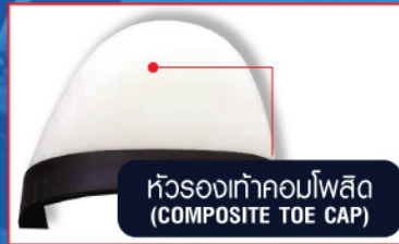
หัวรองเท้าคอมโพสิต (COMPOSITE TOE CAP)