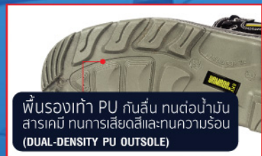
พื้นรองเท้า PU กันลื่น ทนต่อน้ำมัน สารเคมี ทนการเสียดสีและทนความร้อน (DUAL-DENSITY PU OUTSOLE)