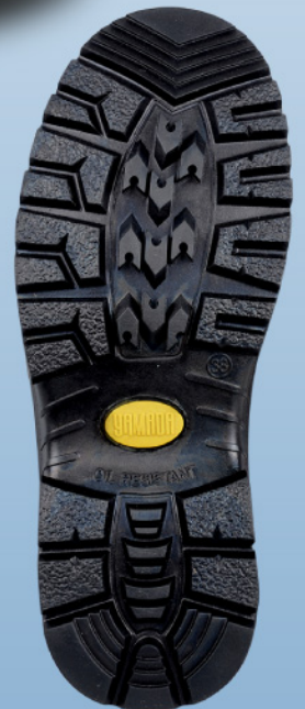
พื้นรองเท้า