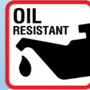
ป้องกันน้ำมัน