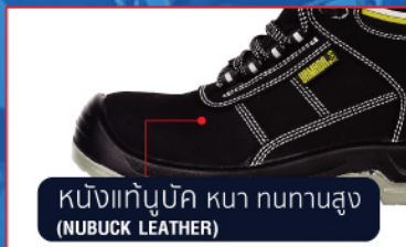
หนังแท้บู๊ค หนา ทนทานสูง (NUBUCK LEATHER)