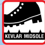
พื้นหลักต้านการทะลุ