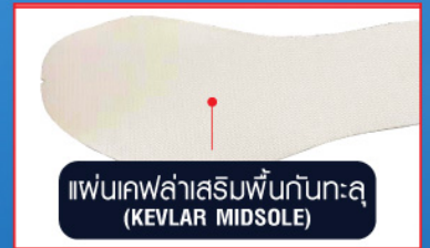
แผ่นเคฟล่าเสริมพื้นกันทะลุ (KEVLAR MIDSOLE)