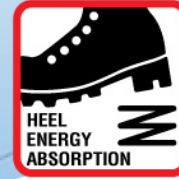
พื้นดูดซับแรงกระแทก