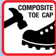
หัวรองเท้ากันกระแทก