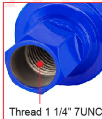
Thread 1 1/4" 7UNC