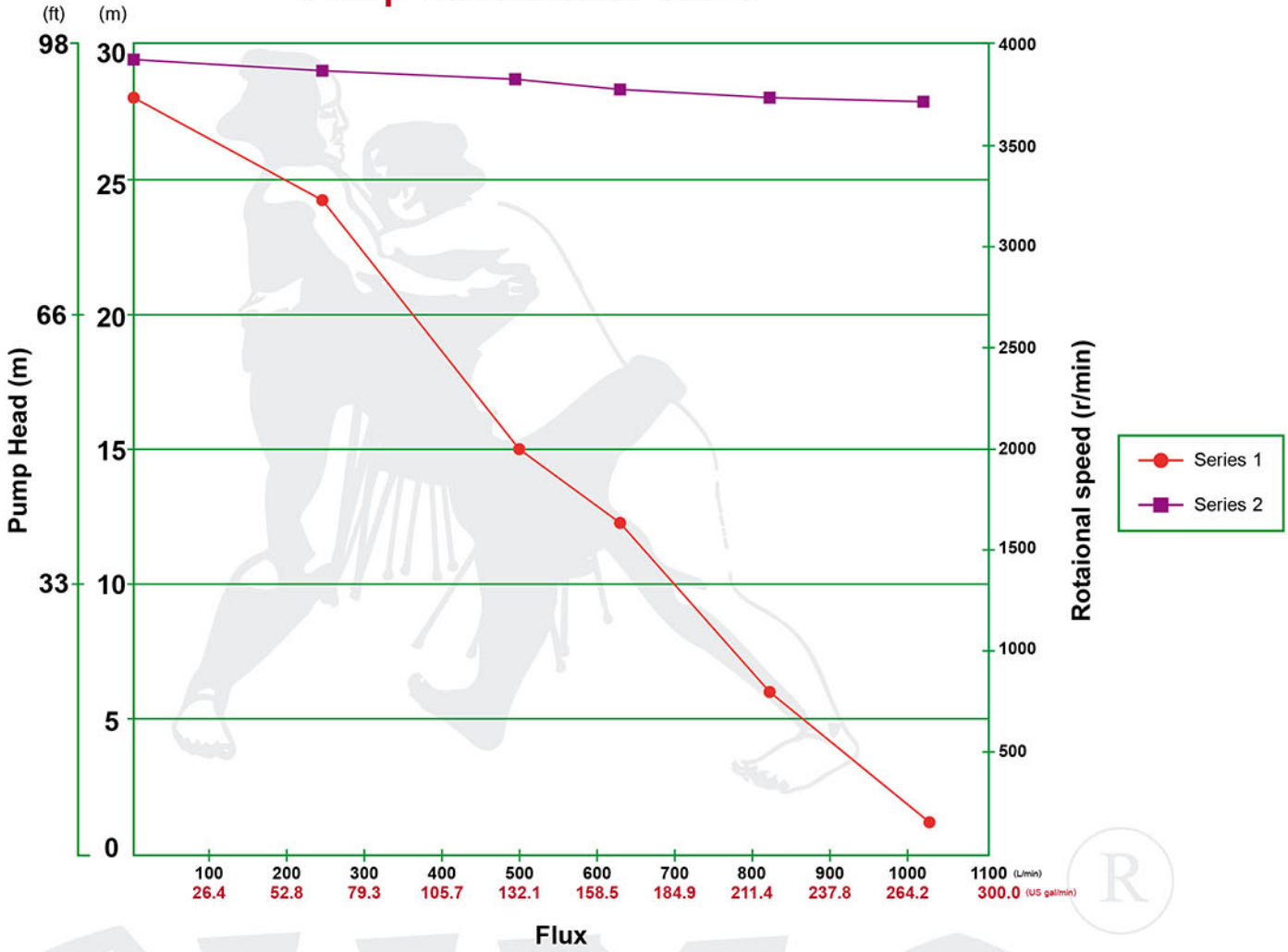
Pump Performance curve